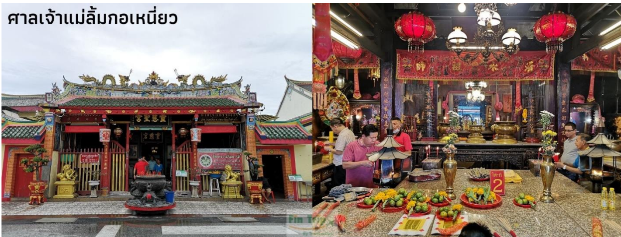
ศาลเจ้าแม่ลี้มกอเหนี่ยว

ต้นไม้ที่ลี้มกอเหนี่ยวผูกคอตายมาแกะสลักเป็นรูปงูชาและสร้างศาลเจ้าขึ้นสักการะ สำหรับองค์เจ้าแม่ลี้มกอเหนี่ยว ท่านเป็นเทพเจ้าแห่งความเมตตาโชคลาภ ค้าขาย ซึ่งเป็นที่นิยมมากกราบไหว้ขอพรเพื่อเป็นสิริมงคลกับชีวิต